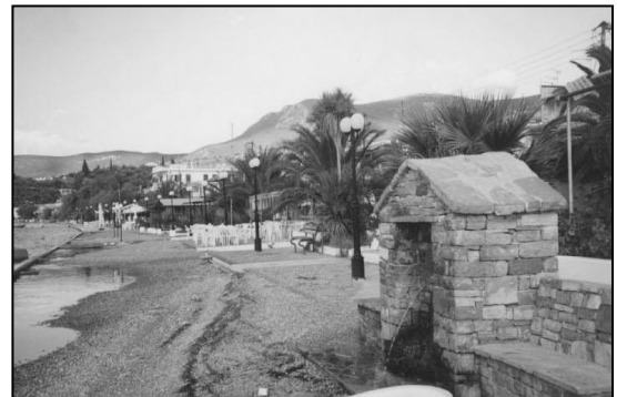
Το χωριό Γλύφα της επαρχίας Φθιώτιδος. Άλλοτε ανήκε στην επαρχία Αλμυρού.

Πληροφορίες για τις αλλαγές που έγιναν στους δήμους το 1999 σύμφωνα με το Σχέδιο Καποδίστρια περιέχονται στο βιβλίο του Χαράλαμπου Χρυσανθάκη « Η Θεσμική Μεταρρύθμιση της Πρωτοβάθμιας Τοπικής Αυτοδιοίκησης, το Σχέδιο "Ιωάννης Καποδίστριας" », έκδοση Αντ. Ν. Σάκκουλα, Σόλωνος 69, 106 79 Αθήνα, τηλ. 03618198 και 03615440.